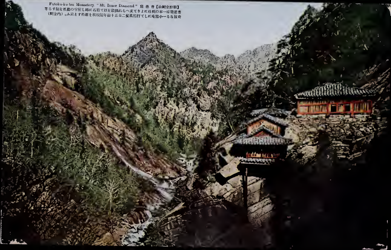
Futoku-ku-tsu Monastery. "Mt. Inner Diamond" 窟徳音【山剛金鮮朝】 ざるす刹を推動の字屋し構に石岩て以を鎮據れらへ支てりよに社祠の本一は窟徳音 （剛金内）。ふ云とす持雄を狀現即年餘十五百二套風雨打てしに庵窟小一なる抜奇